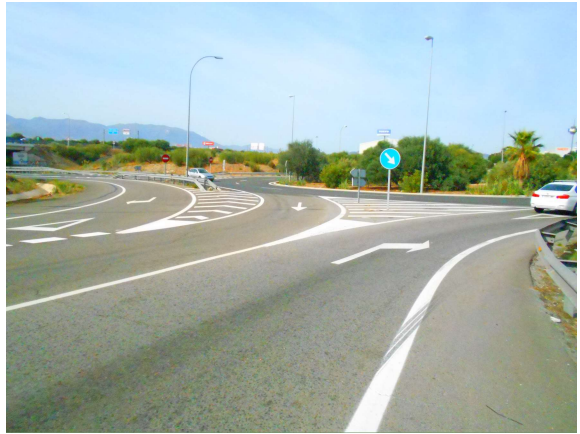
Enlaces A-357: Repintado