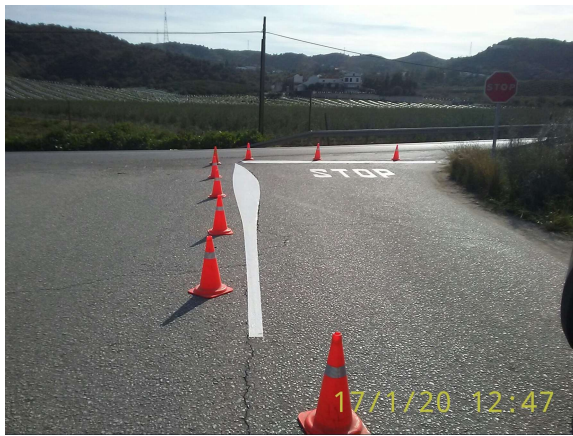
Caserío Salinas: Refuerzo señalización en cruce