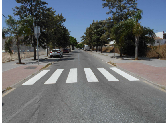
El Brillante: Repintado de los pasos de peatones de la barriada