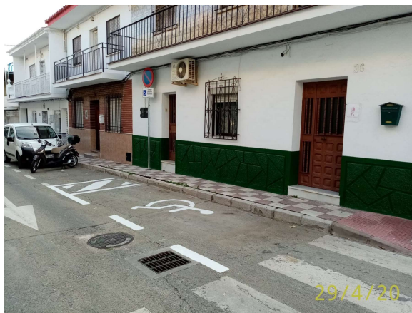
Salino: Nueva reserva