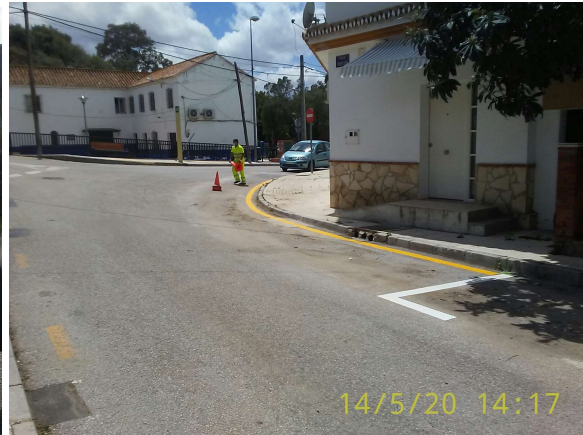
Principal de Colmenarejo: Pintado tramo de calle