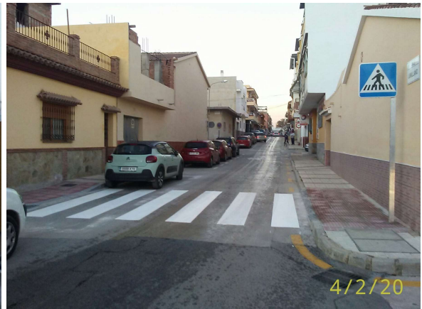
Jumillano y Regaterín: Pintado dos nuevos pasos de peatones