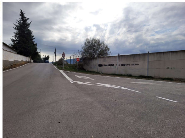
Casteñetero: Pintado tramo calle y refuerzo de cruce