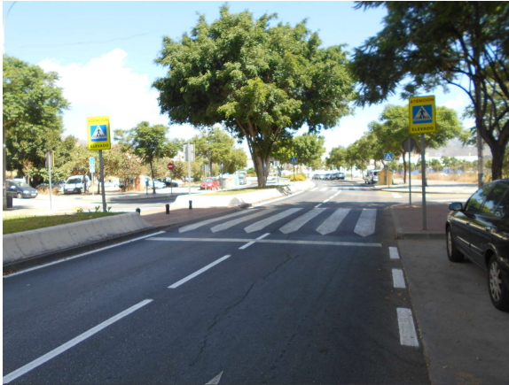
Av. Janes Bowles: Repintado completo de la calle