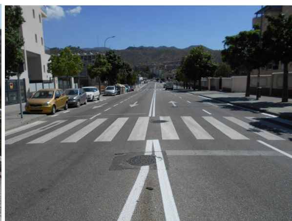
Gounod: Repintado completo de la calle