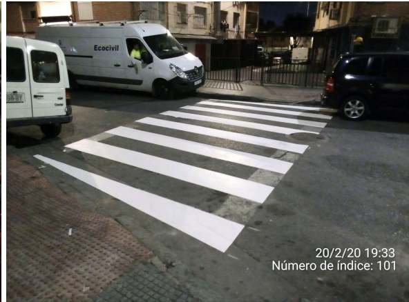
Plaza Conde de Ferrería: Repintado paso de peatones Antonio María Isola: Repintado paso de peatones