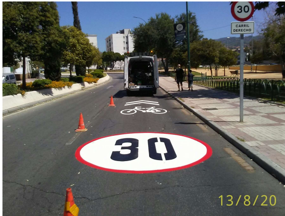
Av. de la Palmilla: Nuevas vías ciclables