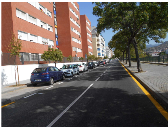
Joaquín Gaztambide: Repintado completo de la calle