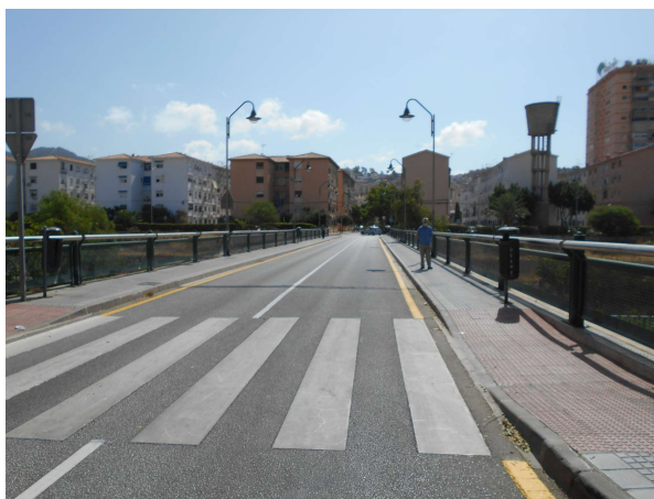
Puente de la Concepción: Repintado completo de la calle