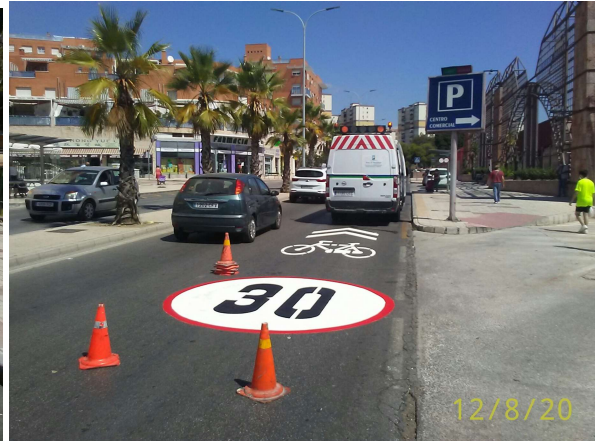
Av. Simón Bolívar: Nuevas vías ciclables