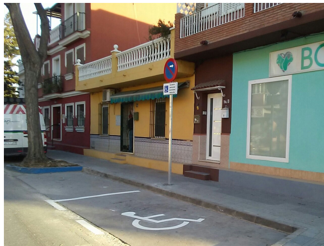
José Calderón: Nueva reserva para personas con movilidad reducida