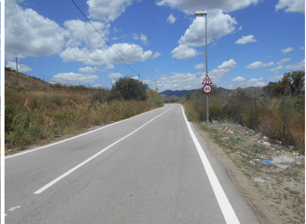
Adonis: Repintado general de la calle