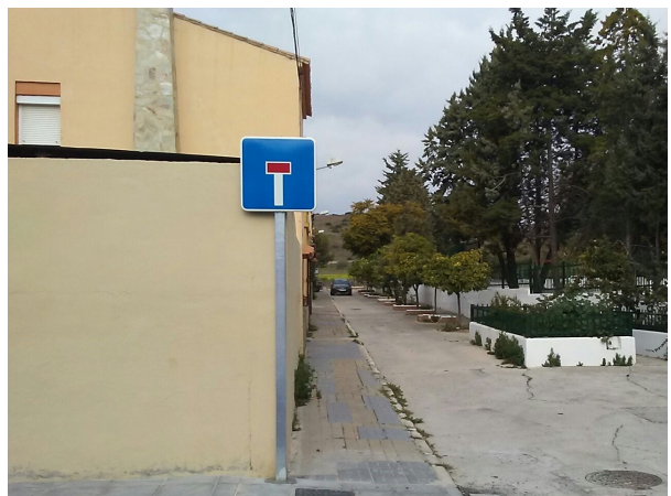
Jeremias: Reordenación de la calle.