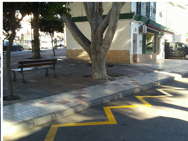
Jacob: Repintado parada bus