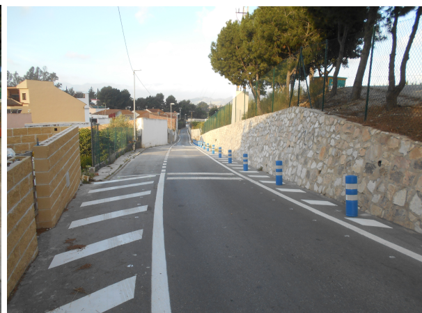
Camino Salas: Repintado general de la calle