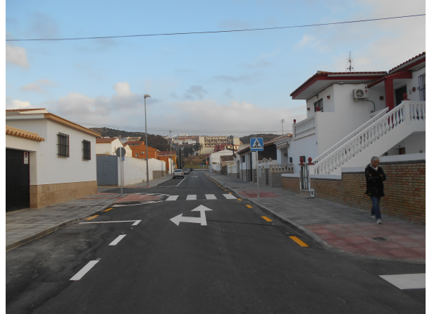
Ronda Poniente: Ordenación de la calle