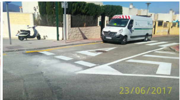
Penélope: Acondicionamiento de intersección