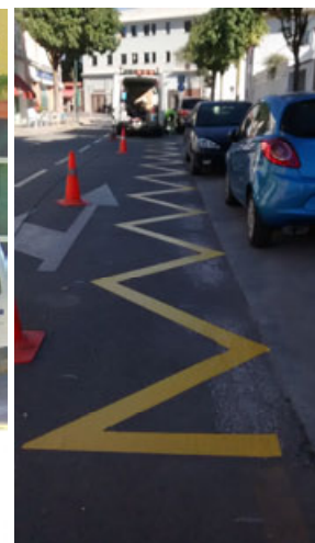
Camoens: Nueva reserva de carga y descarga