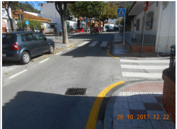
Bauxita: Repintado general de la calle