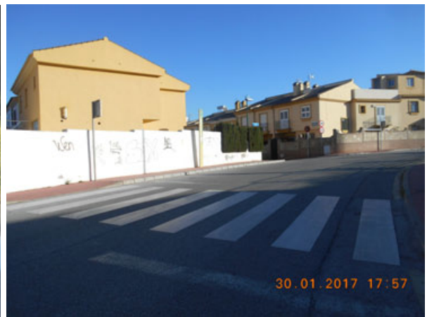
Jacob: Repintado de líneas en tramo de la calle