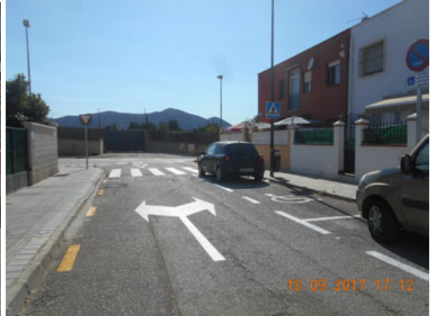
La Celestina: Repintado general de la calle