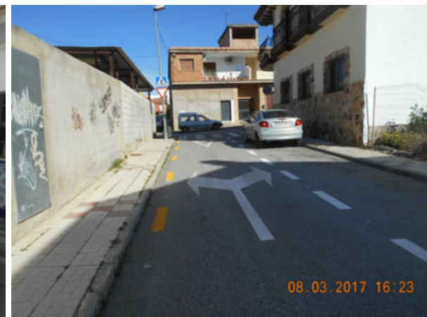
Mosaico: Repintado general de la calle