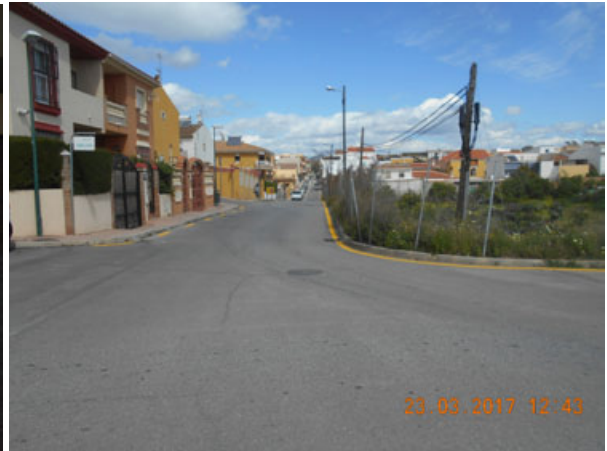
Jumillanos: Ordenación de la calle