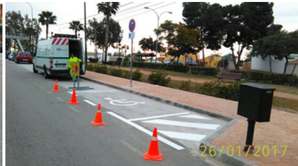
Travesía Maqueda: Nueva reserva para personas con movilidad reducida