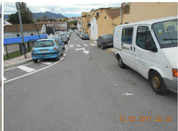
El Requito: Ordenación de la calle