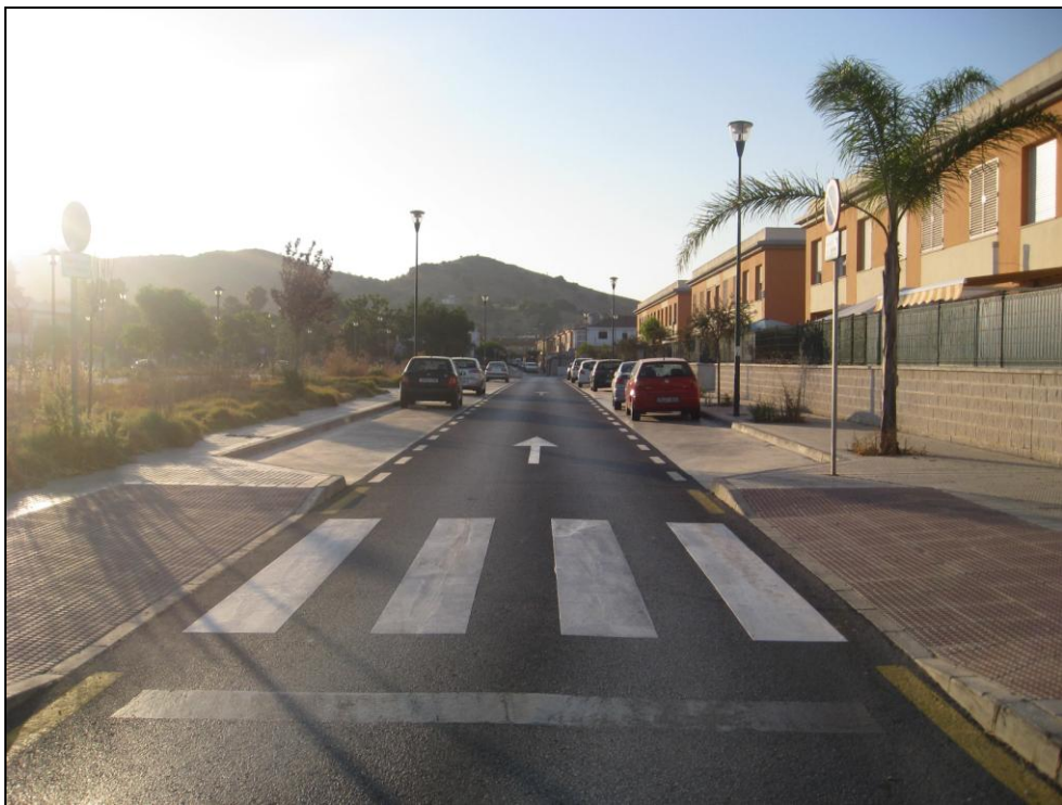
Barriada El Brillante