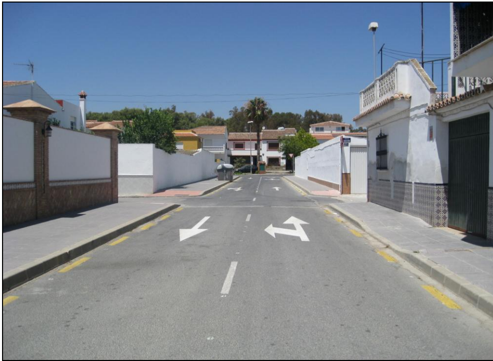
c/ Ronda del Poniente