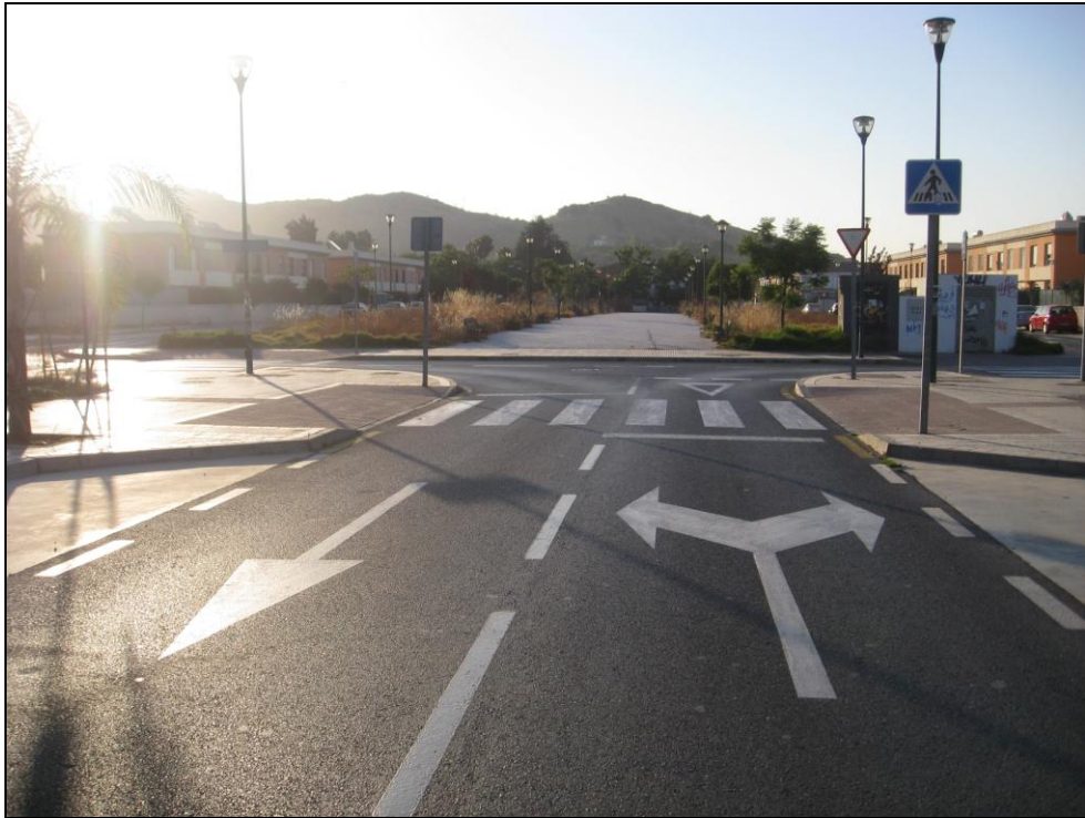
Barriada El Brillante