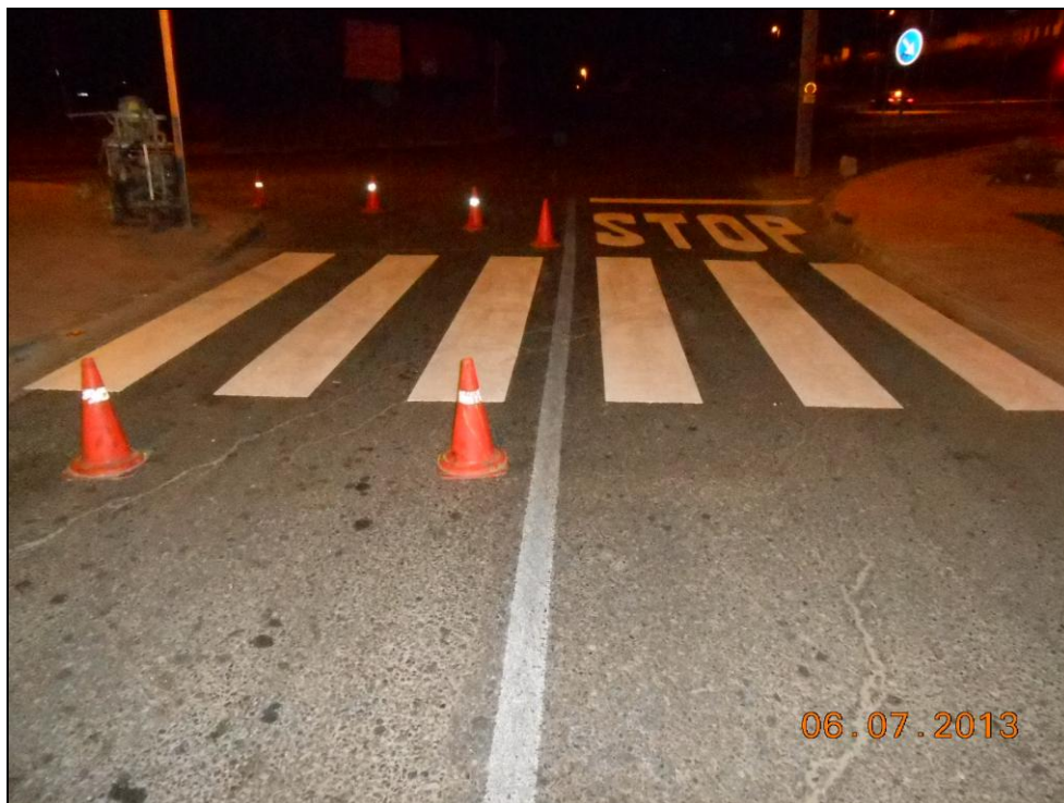
Ronda del Norte