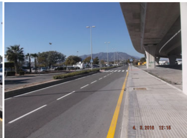
Camino Guadalmar a la Loma: Repintado desde el enlace con la autovía hasta la glorieta