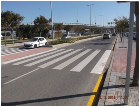
Camino del Pilar: Ordenación de carriles de circulación