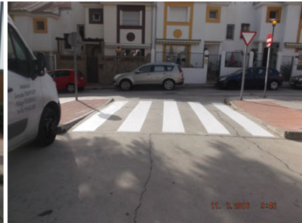
Plaza Niña de los Peines: 2 pasos de peatones nuevos