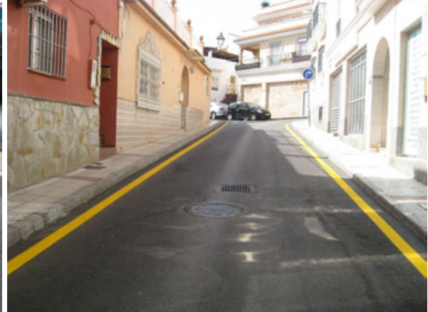
C/ Gabriel Miró: Repintado general de la calle