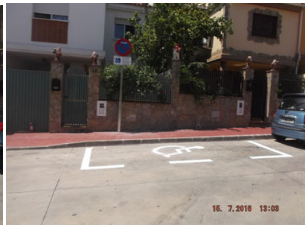
c/ Juan de Arriaga: Nueva reserva para personas con movilidad reducida