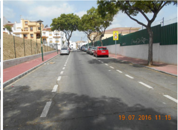
C/ Gaspar Sanz: Repintado general de la calle