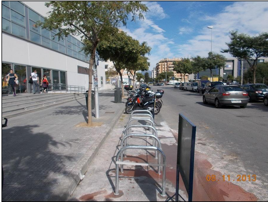
c/ Marilyn Monroe