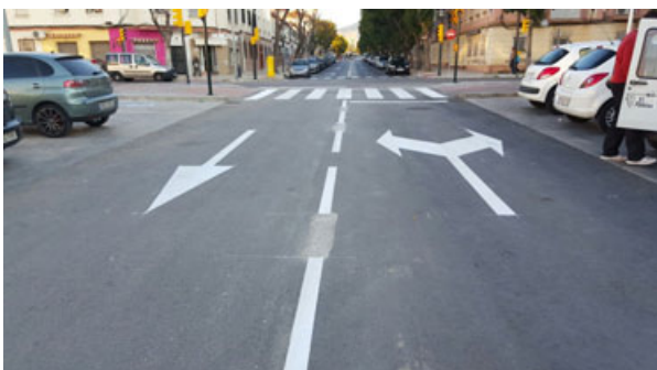
c/ Don Quijote: Refuerzo señalización del cruce