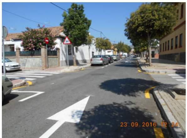
c/ Virgen del Rosario: Ordenación del estacionamiento