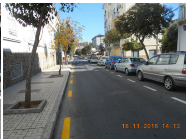
c/ Virgen de la Paloma: Repintado general de la calle