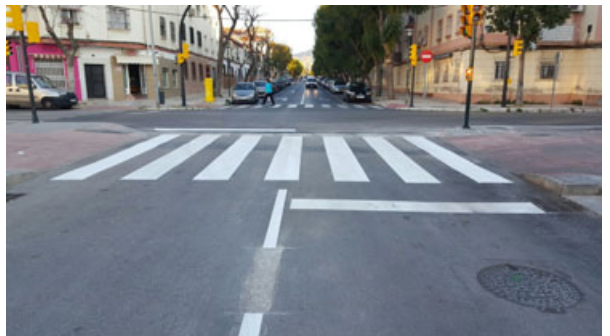
Plaza de la Biznaga: Acondicionamiento para nuevo cruce semafórico