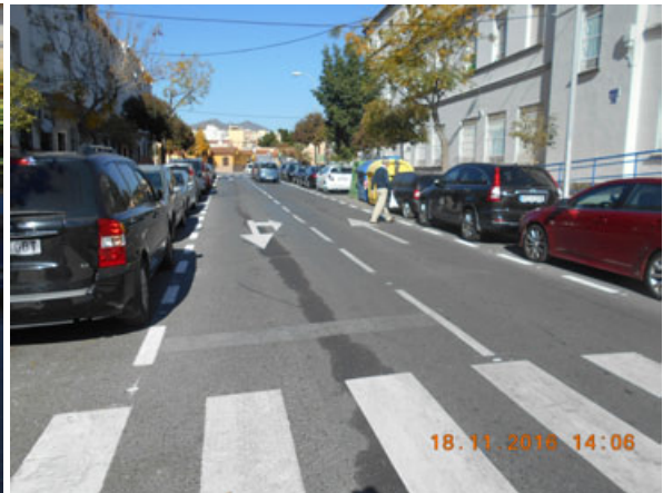
c/ Virgen de las Flores: Repintado general de la calle