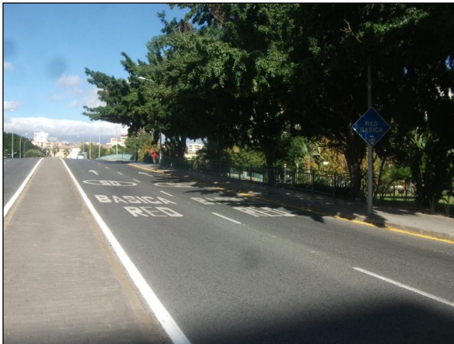
Puente de las Américas