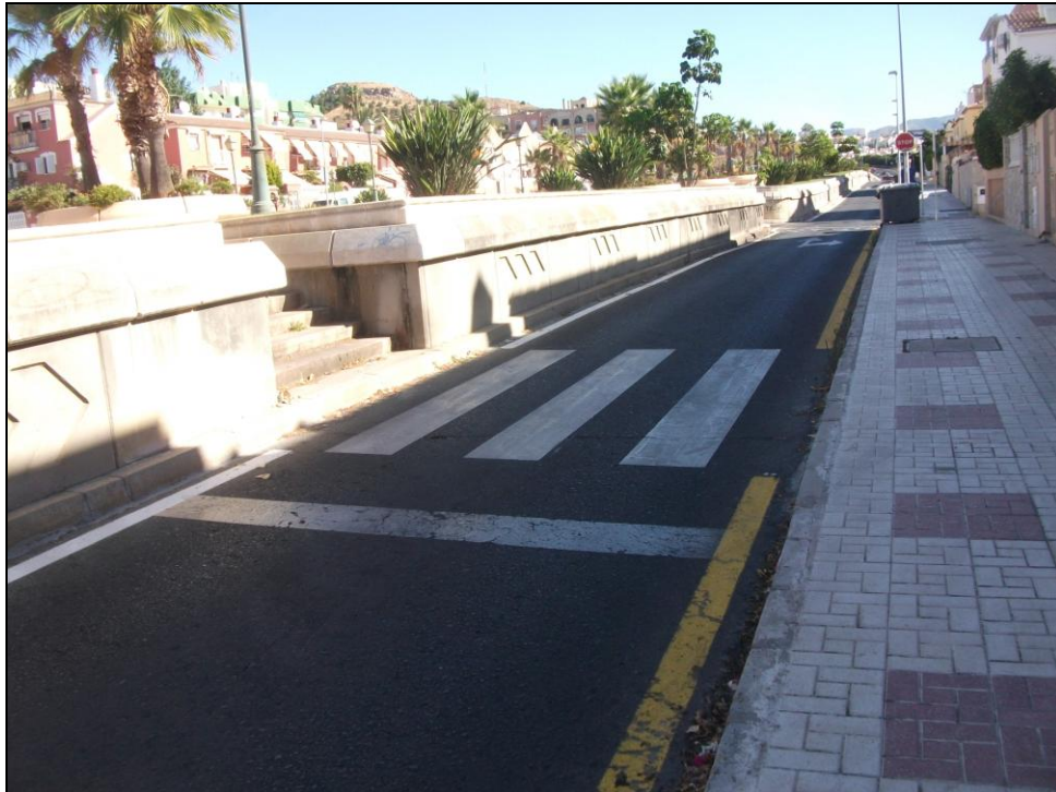
c/ Ortega de Prados