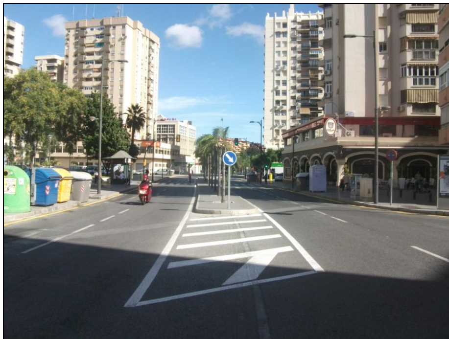
Av. de la Aurora