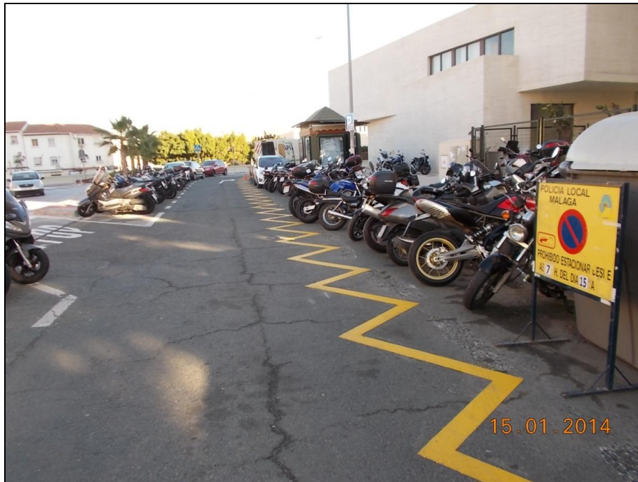
c/ Corregidor Francisco de Molina