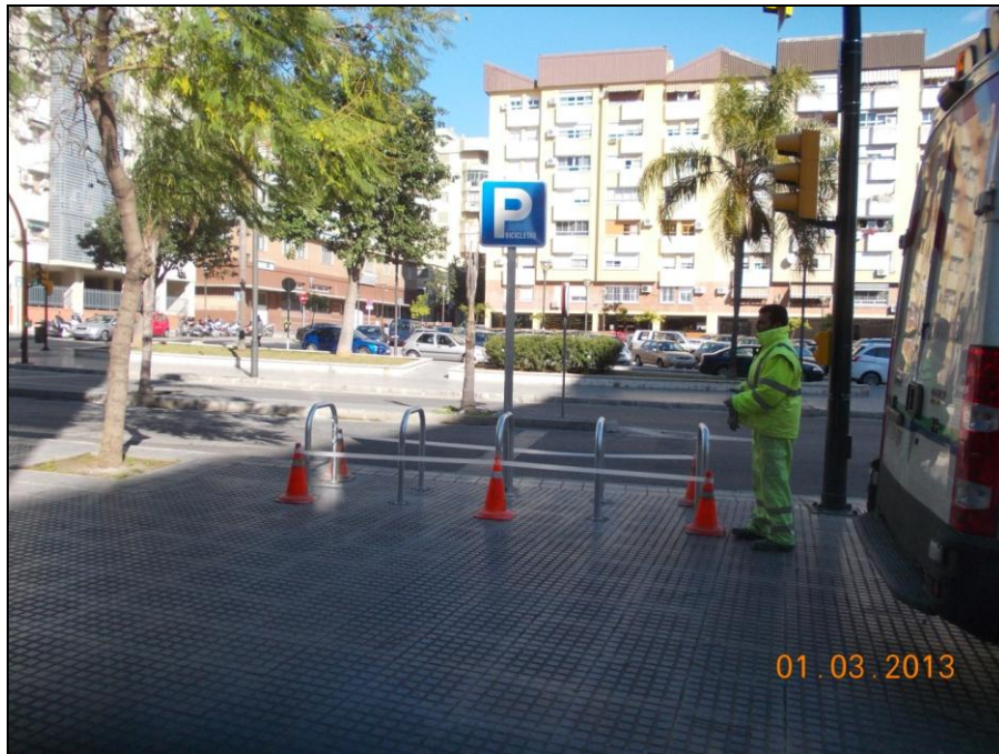
Av. de la Aurora