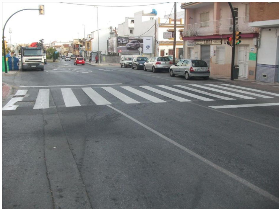
Camino de los Prados