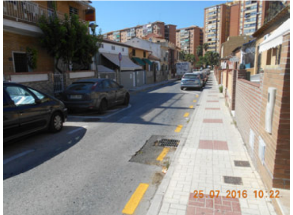
c/ Alcalde Ronquillo: Repintado completo de la calle