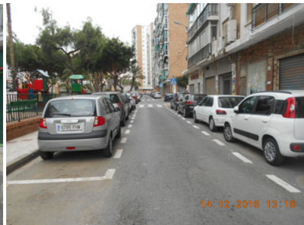
Plaza Conde de Ferrería: Pintado completo de la calle