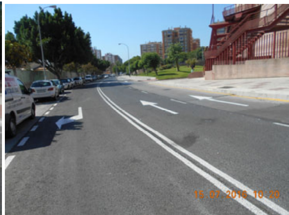
c/ Mark Twain: Repintado completo.