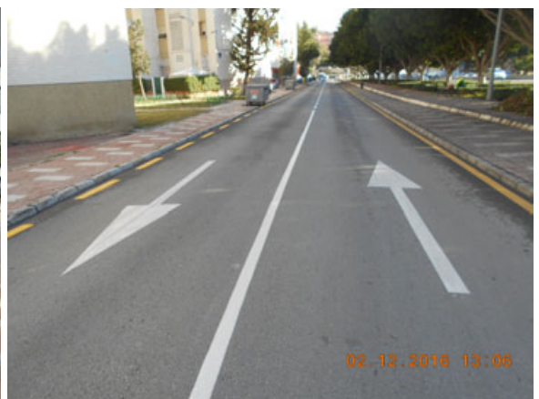
c/ Bidasoa: Repintado completo de la calle