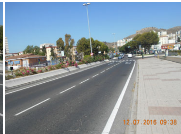
Puente del Mediterráneo: Repintado completo.