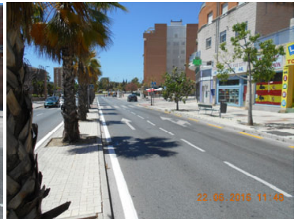
Av. Simón Bolívar: Repintado completo de la calle.