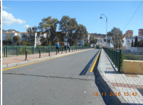
Puente de la Palmilla: Pintado completo de la calle