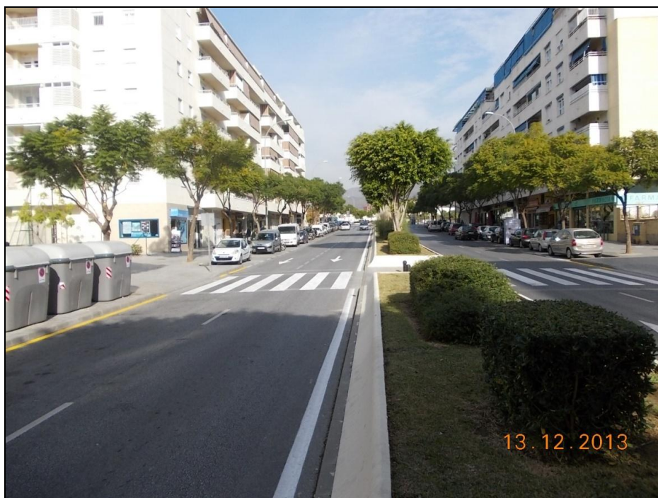
Av. Janes Bowles