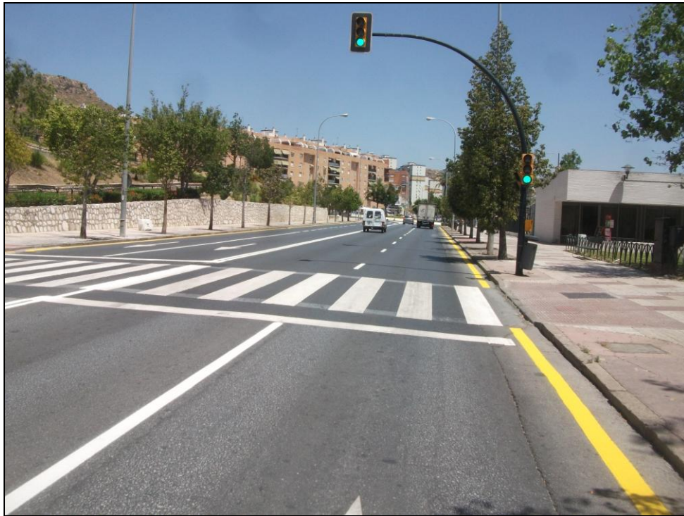
Av. Simón Bolívar