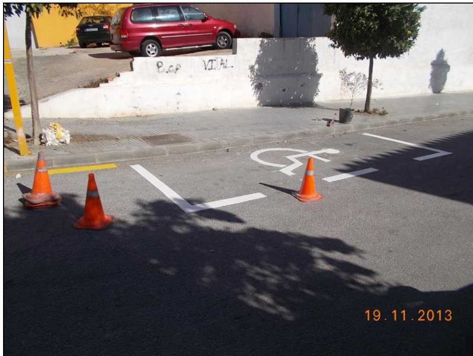
c/ Atahualpa Yupanqui