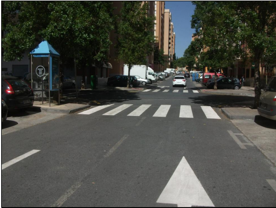
Barriada La Roca