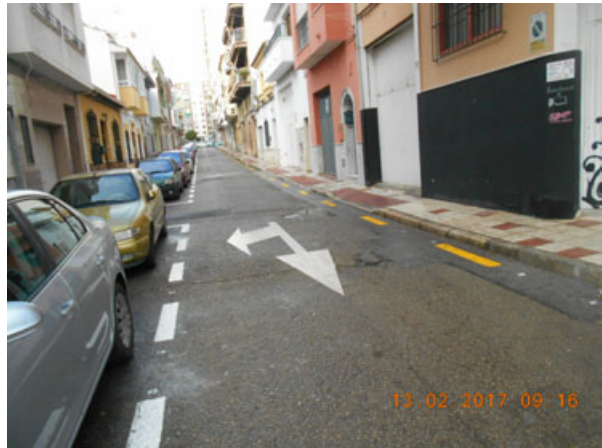
González Anaya: Repintado general de la calle