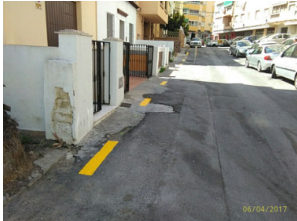
Pasaje Venegas y c/ Gazules: Reordenación de las calles