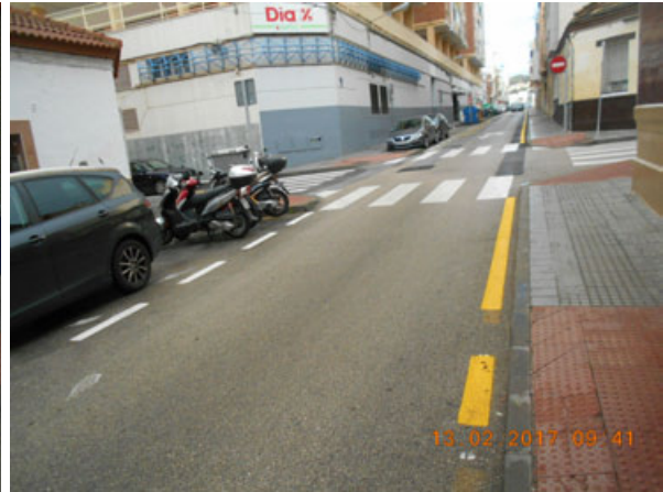
Rafaela: Repintado general de la calle