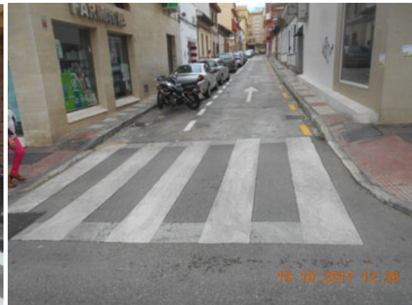
Domingo Savio y Filipinas: Repintado general de las calles