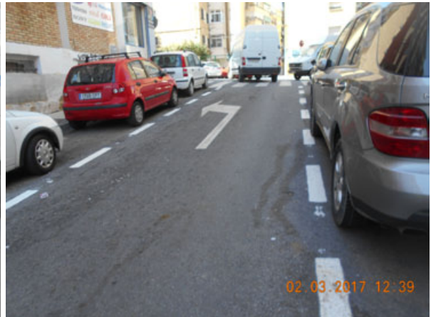
Tejares: Repintado general de la calle