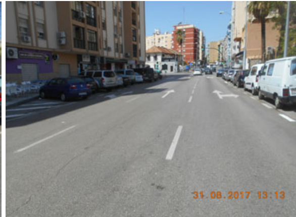
Velarde: Repintado general de la calle