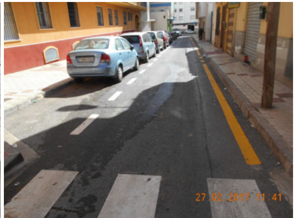
Jamaica: Repintado general de la calle