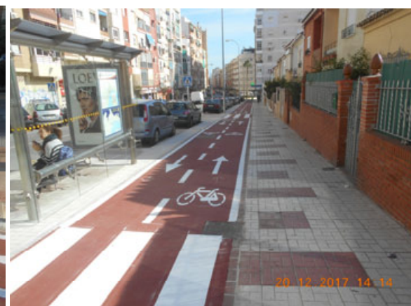
Nuestra Señora de los Clarines: Nuevo carril bici