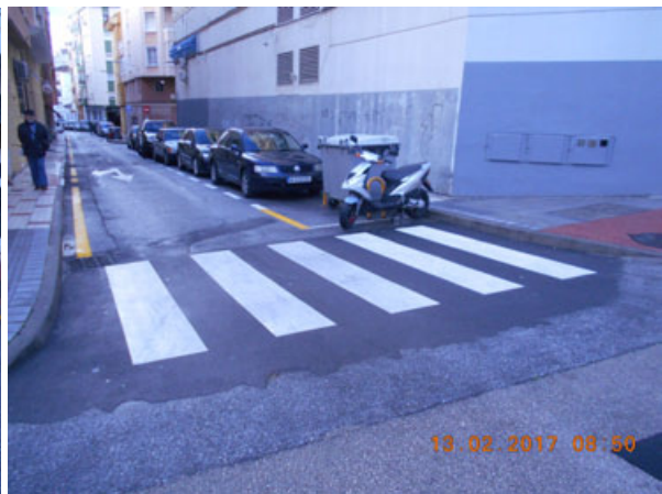
Natalia: Repintado general de la calle