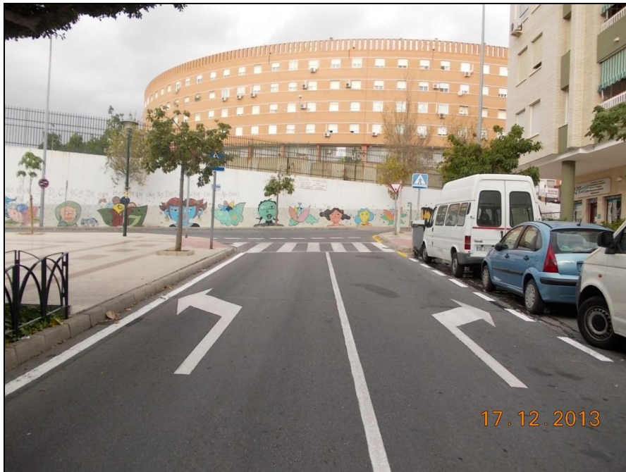
c/ Jose Iturbi