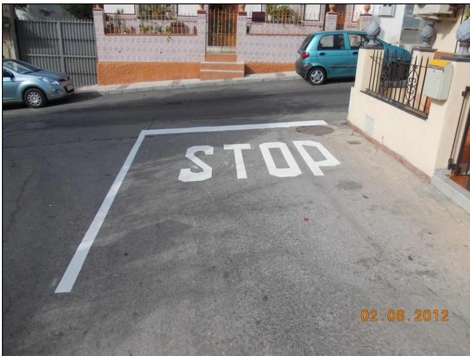
c/ Las Granjas