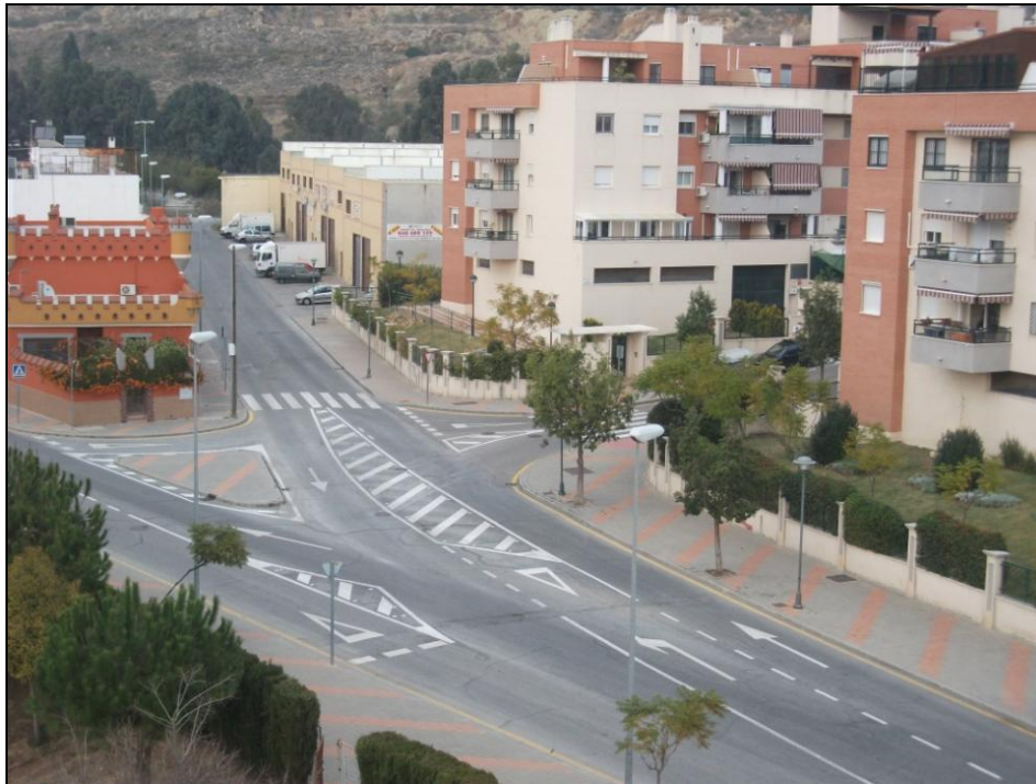
c/ Miguel Hernández