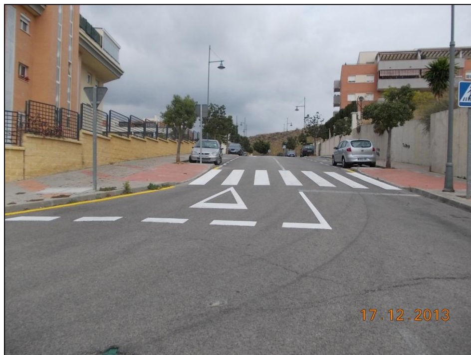
Urbanización Hacienda Miraflores