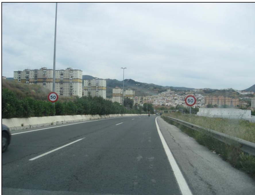
Av. Valle Inclán