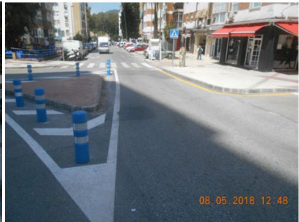
Alcalde Joaquín Quiles: Acondicionamiento de intersección.