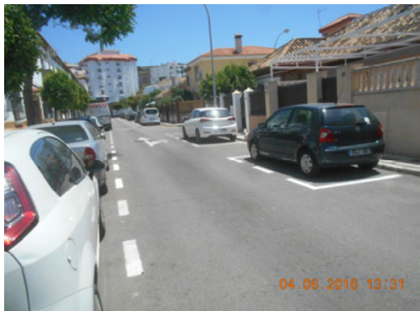
Dolores Cortés: Repintado general de la calle