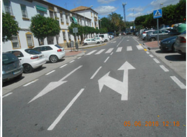
Emilio Thuillier vial de servicio: Repintado general de la calle.