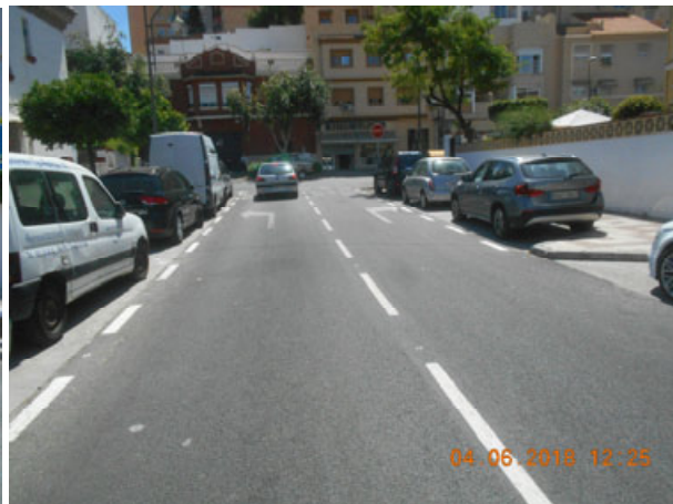
Leoncio Talavera: Repintado general de la calle