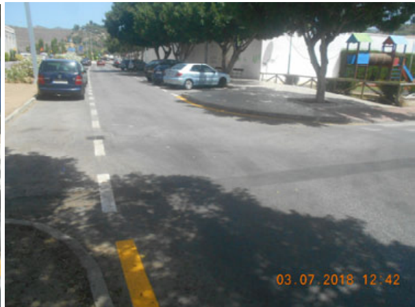
Av. Jacinto Benavente vial servicio: Repintado general de la calle.