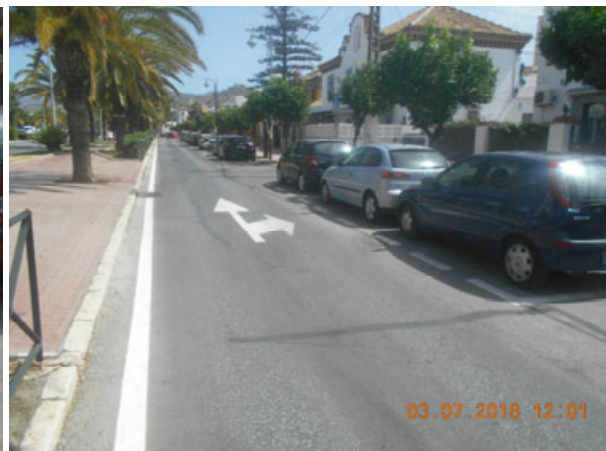
Av. Ramón y Cajal vial de servicio: Repintado general de la calle.