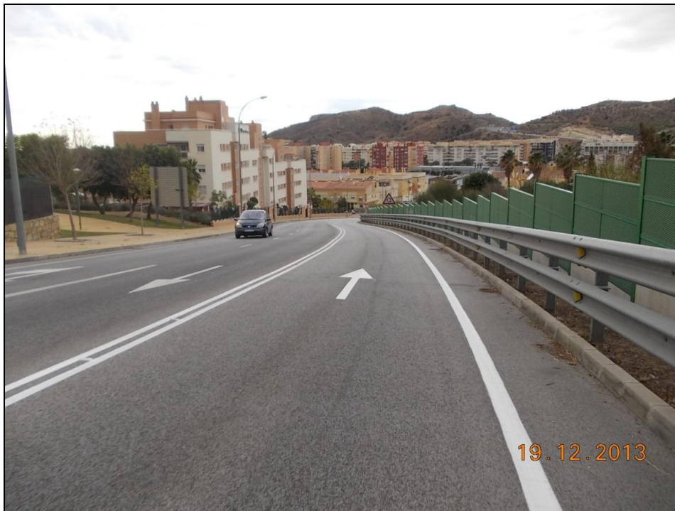
c/ Pepa Flores "Marisol"