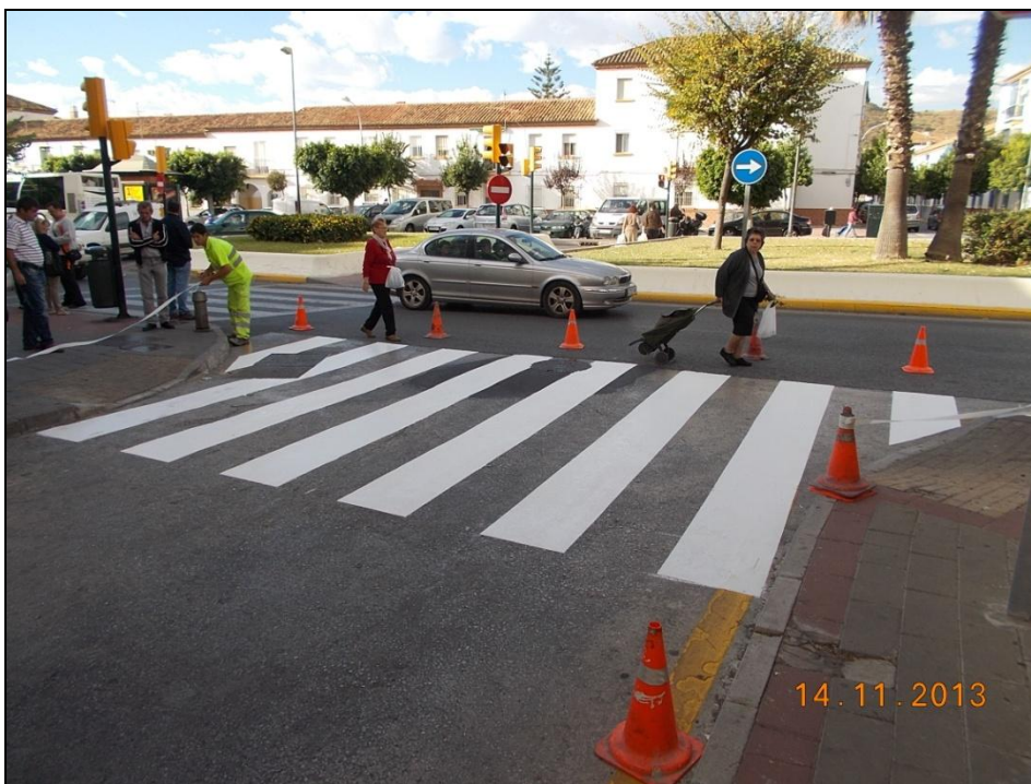
c/Escultor Mariano Benlliure