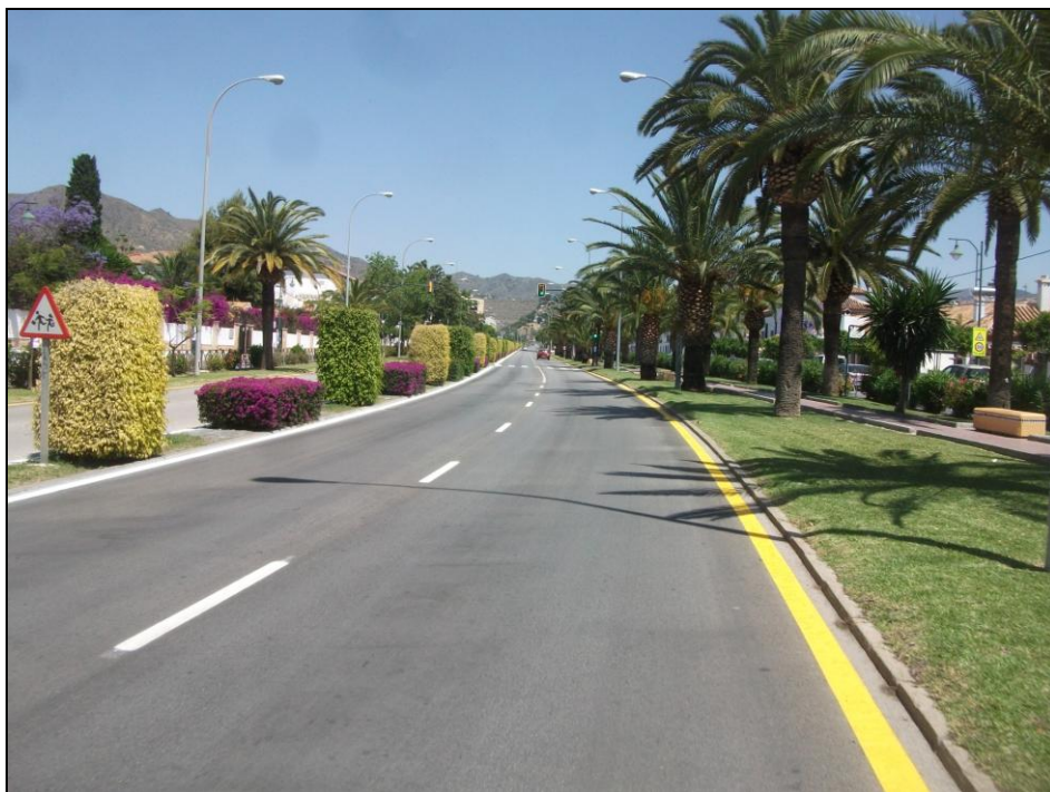
Av. Santiago Ramón y Cajal