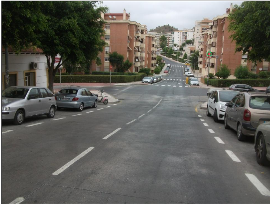
c/ Jerez Perchet