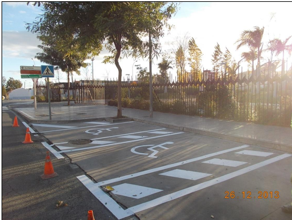
Parque de la Alegría