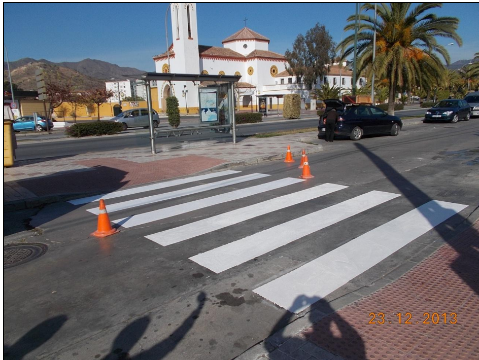
Av Santiago Ramon y Cajal