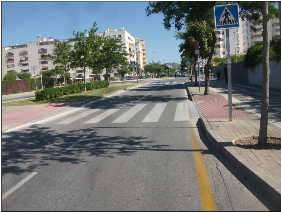
Av. Gregorio Prieto