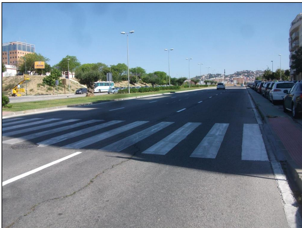
Av. Dr. Manuel Domínguez