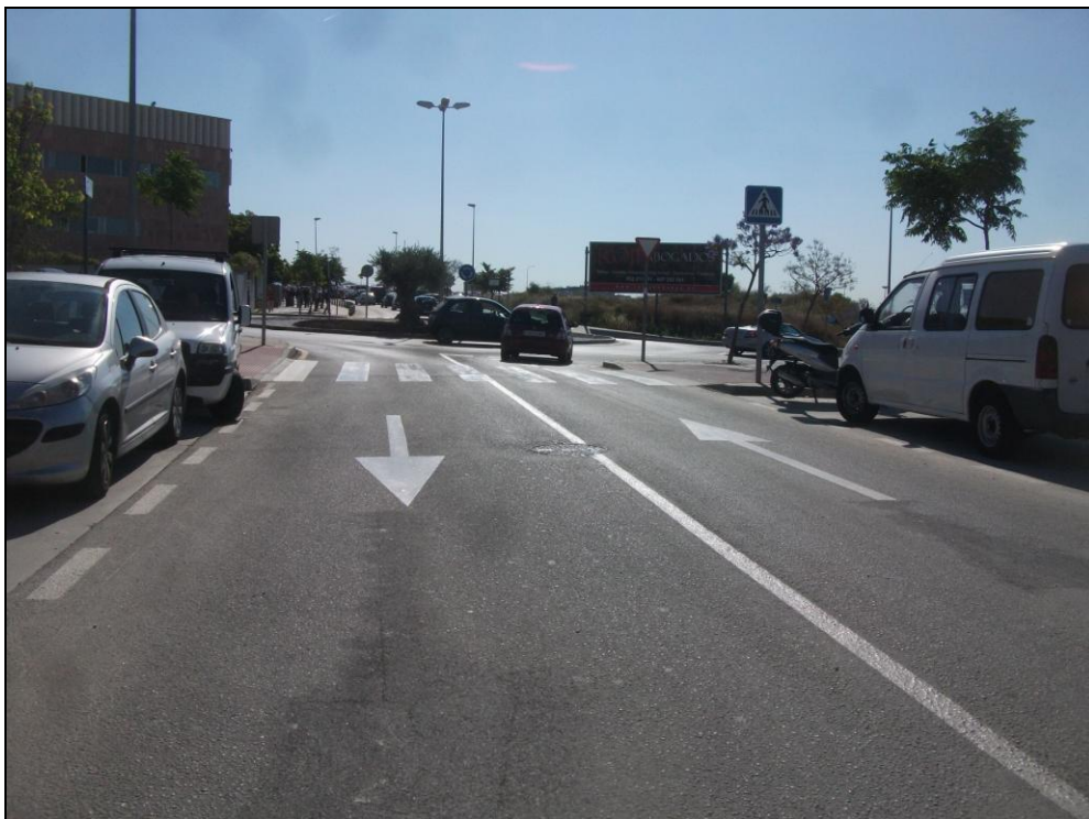
c/ Decano Agustín Moreno