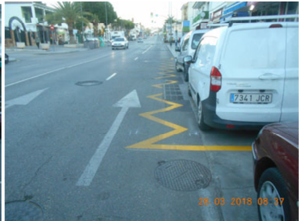
Lope de Rueda: Nueva reserva de carga y descarga