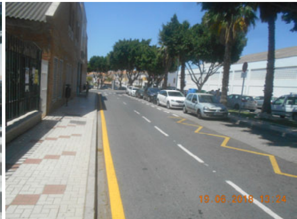
Av. Andersen: Repintado general de tramo de calle