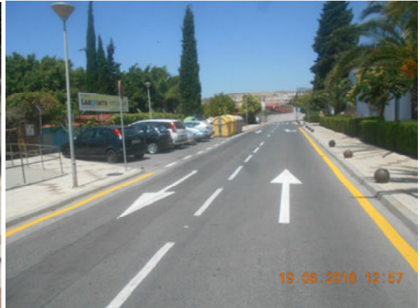
Pedro Garfias: Repintado general de la calle.