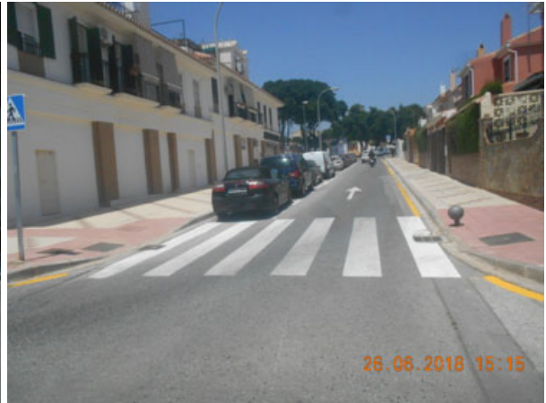
Balzac: Repintado general de la calle