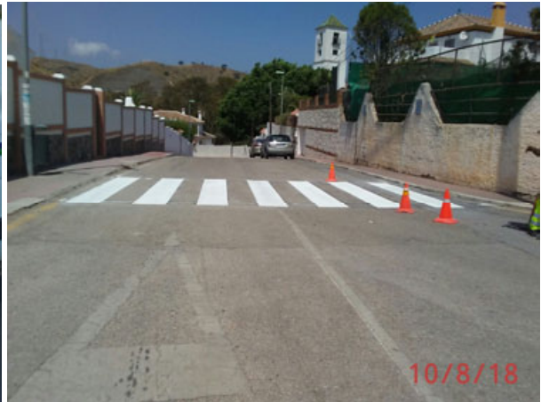
Puertosol: Repintado pasos peatones