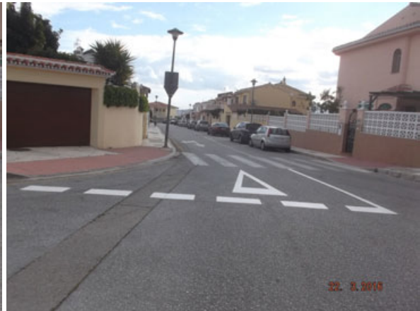
c/ Brezo: Refuerzo en cruce