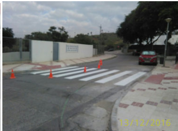
c/ Plauto con c/ Terencio: Nuevos pasos de peatones