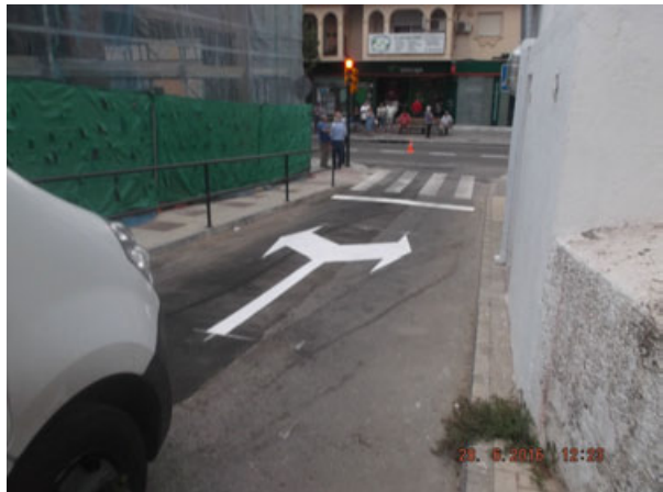
c/ Lope de Rueda: Nuevo paso de peatones para cruce semafórico.