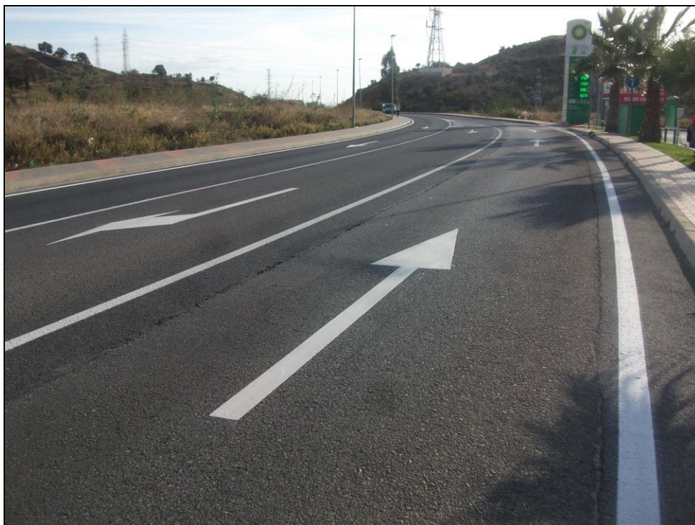
Conexión con Puerto de la Torre