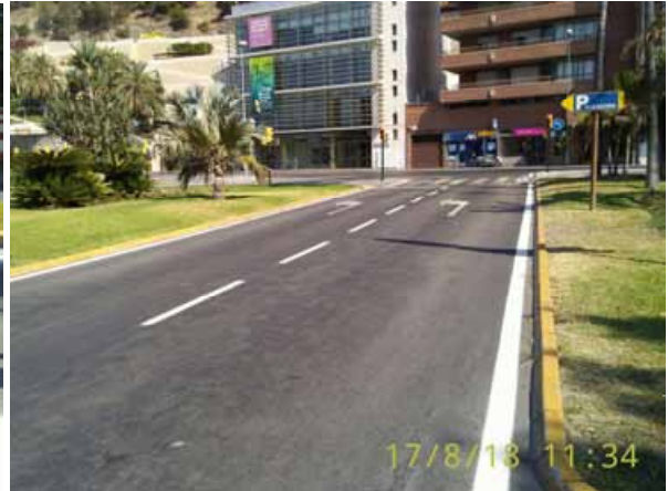
Plaza General Torrijos: Repintado general de la calle.