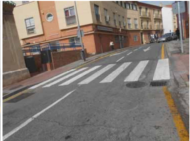
Carrera Capuchinos: Repintado general de la calle