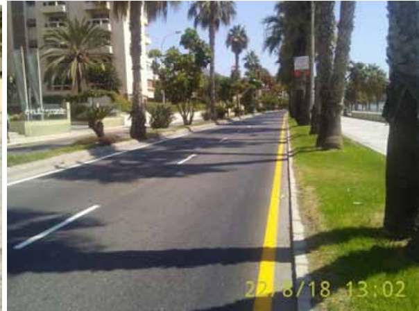
Paseo Marítimo Pablo Ruiz Picasso: Repintado general de la calle