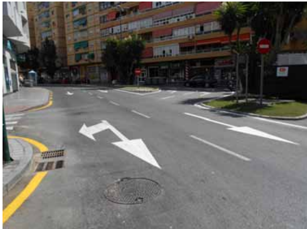
Alameda Capuchinos: Repintado general de la calle