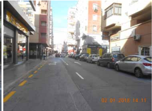
Plaza de Toros Vieja: Repintado general de la calle