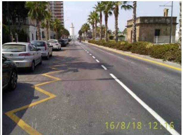
Paseo de la Farola: Repintado general de la calle.