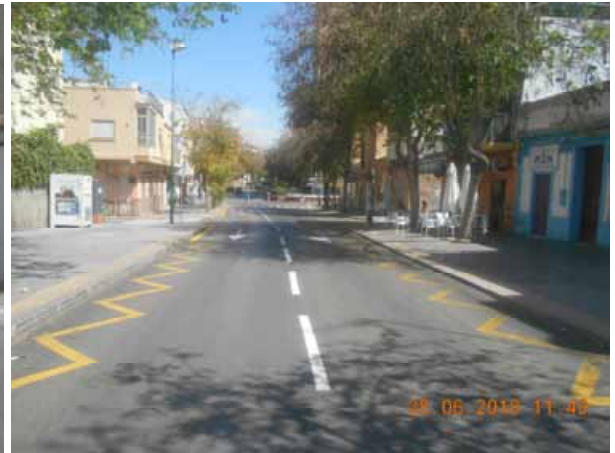
San Juan Bosco: Repintado general de la calle.