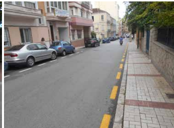
c/ Luis de Maceda: Repintado general de la calle