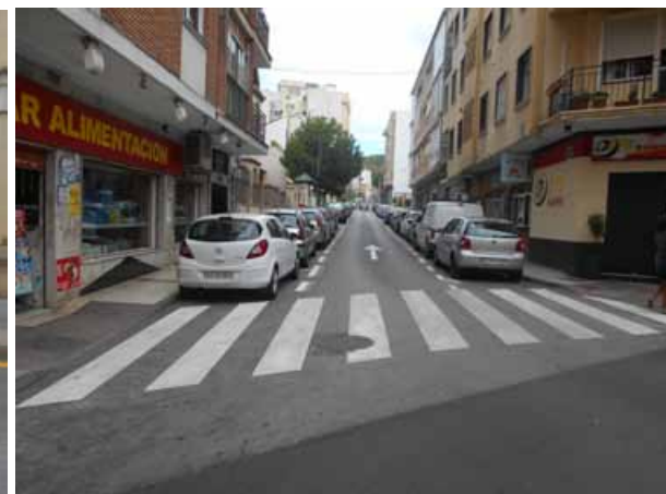
c/ Amargura y c/ Hurtado de Mendoza: Repintado general de las calles