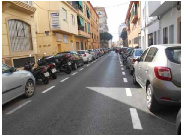
Salamanca: Repintado general de la calle