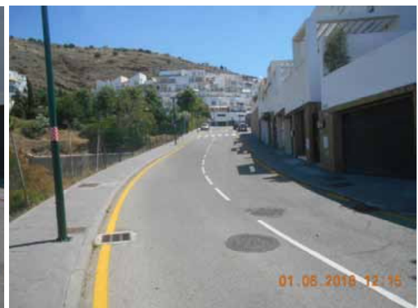
Felix Revello de Toro: Repintado general de la calle.