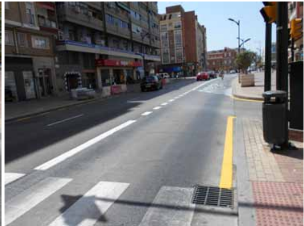
c/ Cuarteles: Repintado general de la calle