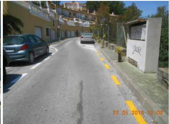
Apamares: Repintado general de la calle.