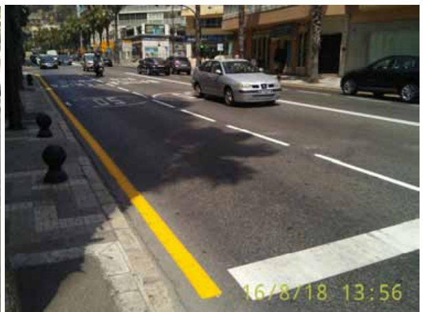
Cánovas del Castillo: Repintado general de la calle.