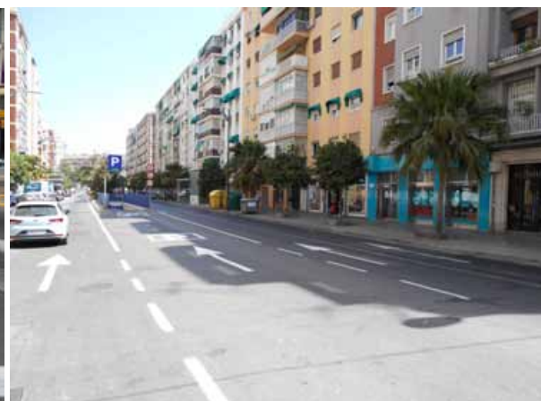
c/ Salitre: Repintado general de la calle