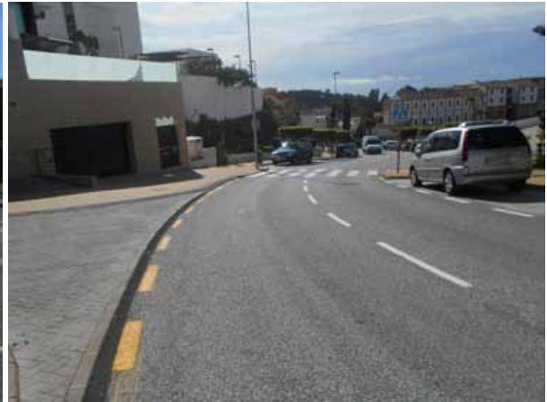
c/ Decano Ignacio Alaminos y adyacentes: Repintado general de las calles