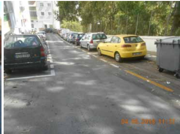
Pinosol: Repintado general de la calle.