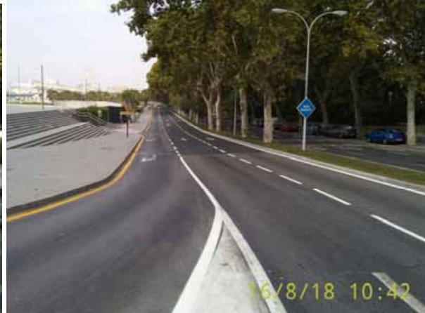
Paseo de los Curas: Repintado general de la calle