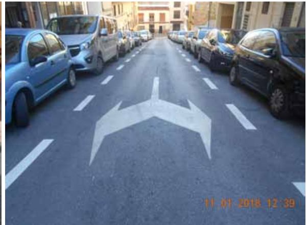
Carrión: Repintado general de la calle