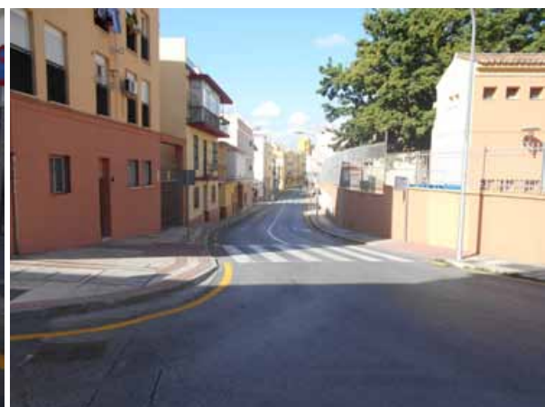
Marqués de Cádiz: Repintado general de la calle