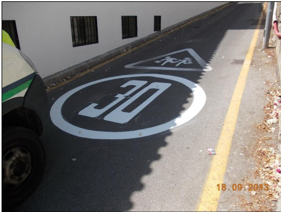
Camino del Monte