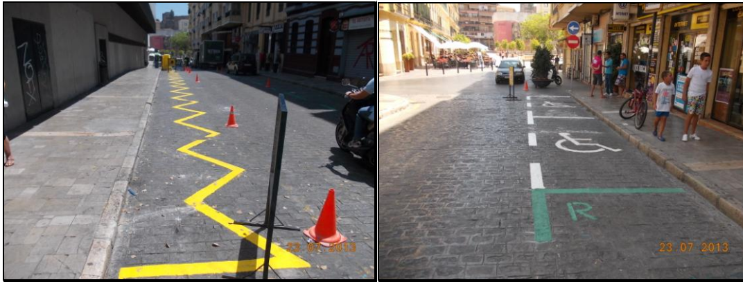
c/ Gómez Pallete