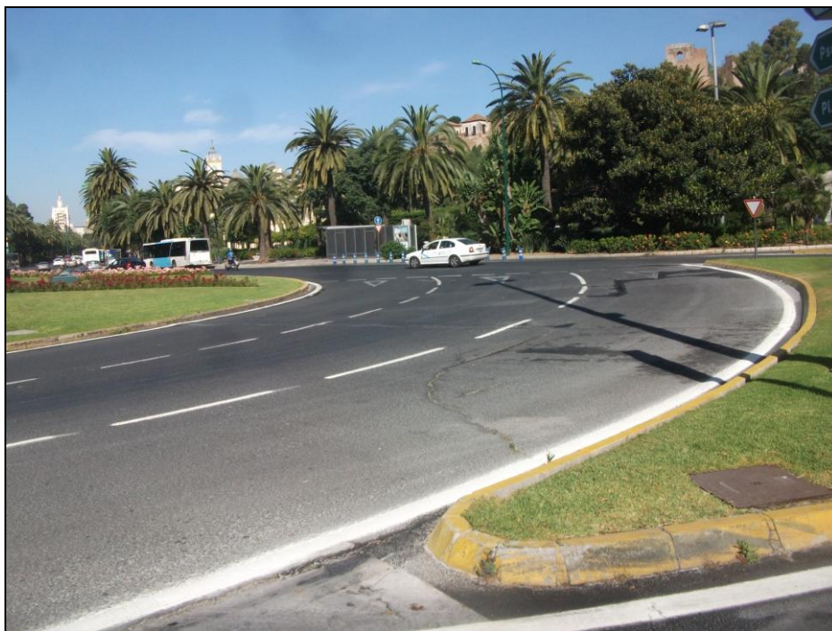
Plaza General Torrijos